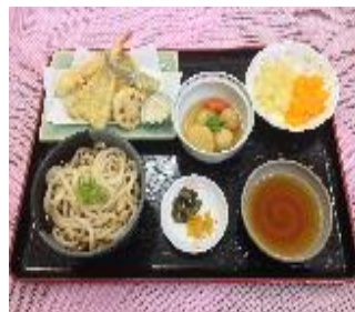
天ぷらうどん (そば有り)