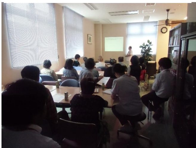
参加者の皆さんの様子

平成 28 年 6 月 7 日 (火) 14:00 から 呉羽総合病院のメディカルサロン・す まいる (人間ドック控室) にて福島県 立医科大学の研究班と協同で「がん治 療後のサバイバーの学習&交流の場」が 開催されました。